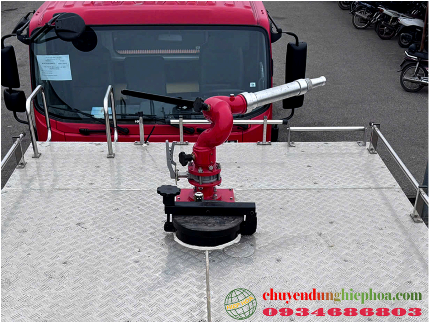
ẢNH SÚNG PHUN NƯỚC TRÊN NÓC XE