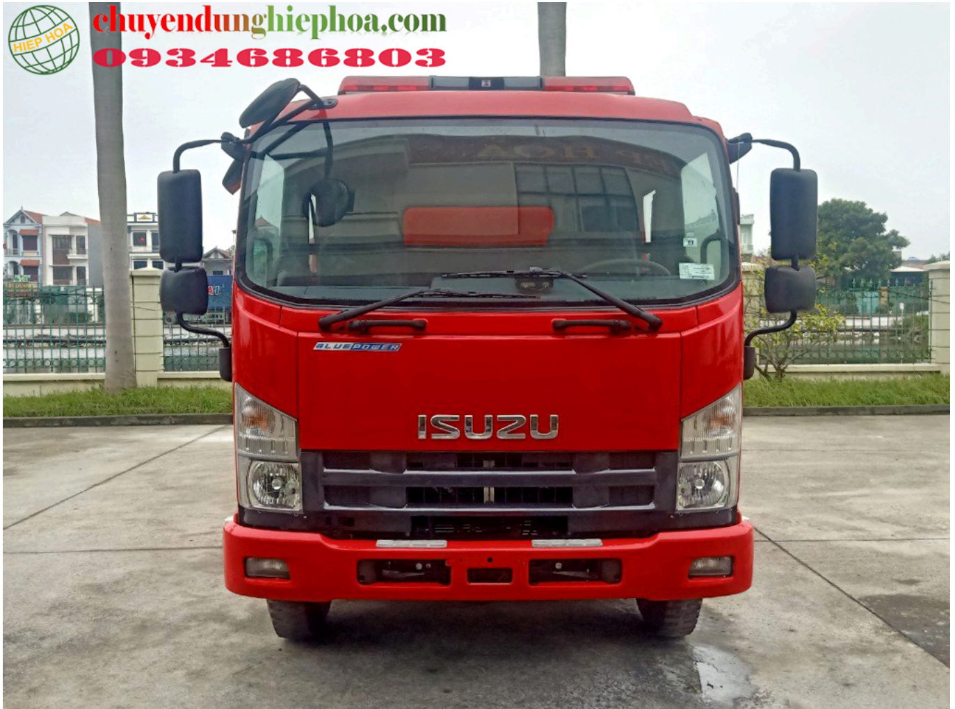
ẢNH CHÍNH DIỆN PHÍA TRƯỚC