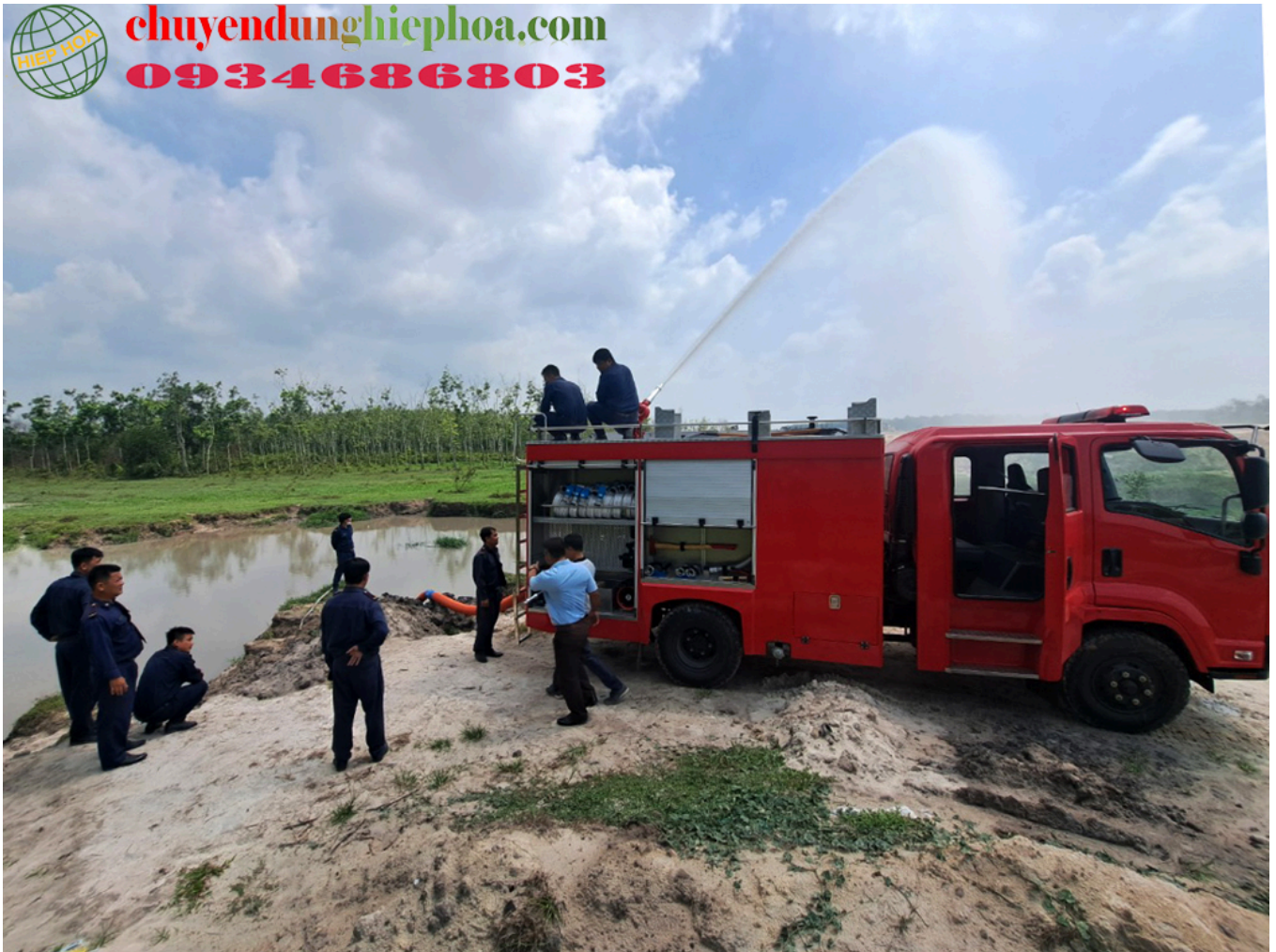
ẢNH XE CHỮA CHÁY ĐANG VẬN HÀNH TẠI KCN BMC BÌNH PHƯỚC