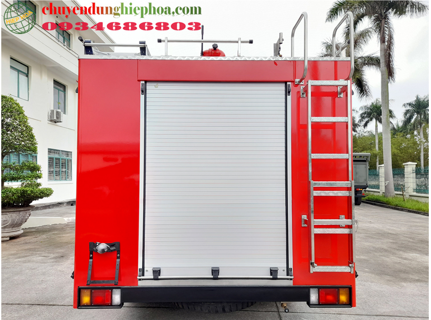
ẢNH CHÍNH DIỆN PHÍA SAU XE