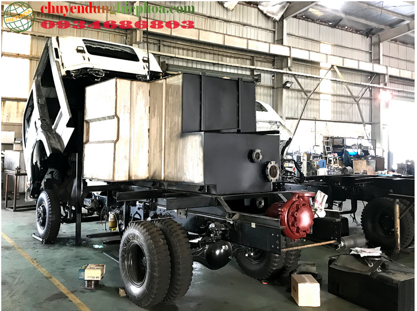
ẢNH BỐ TRÍ BỒN NƯỚC VÀ BƠM CHỮA CHÁY TRÊN XE

Bồn nước chữa cháy 3.800 lít + bồn Foam 400 lít