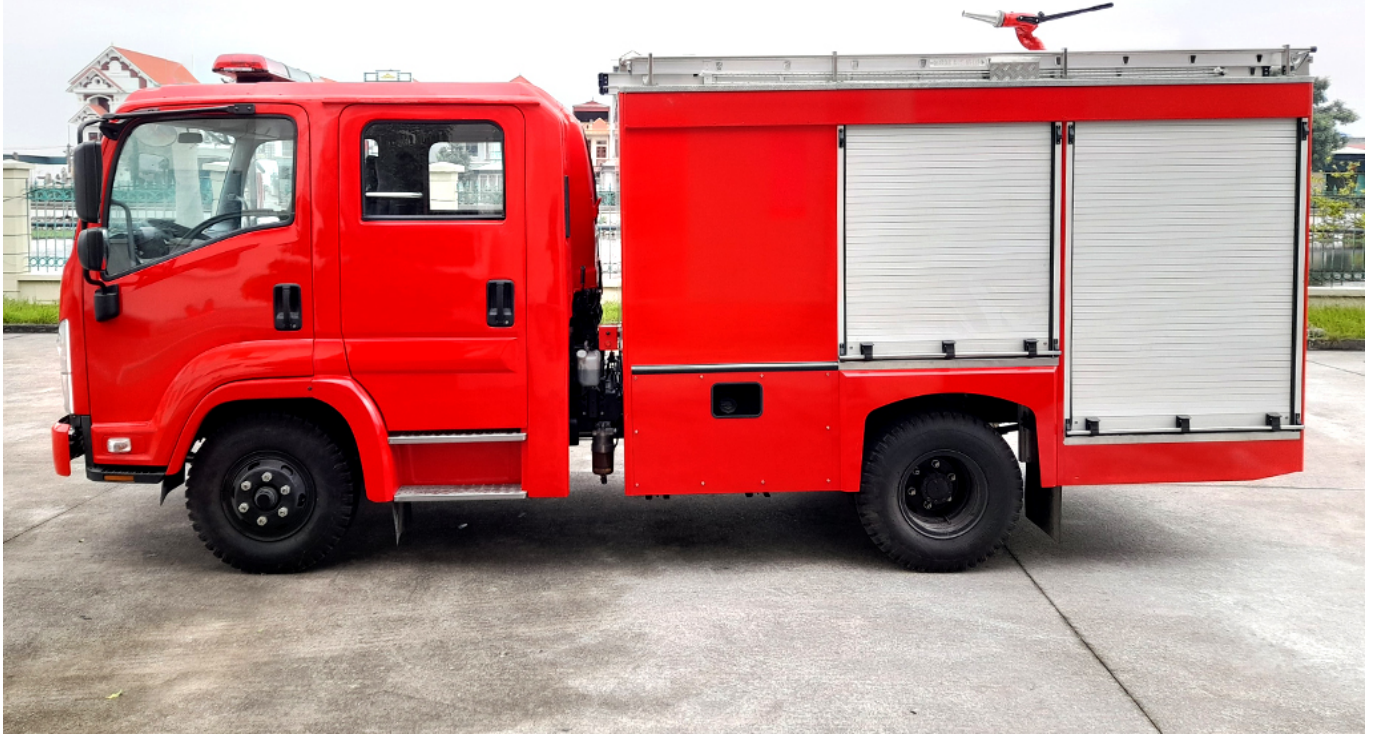
ẢNH CHÍNH DIỆN BÊN TÀI