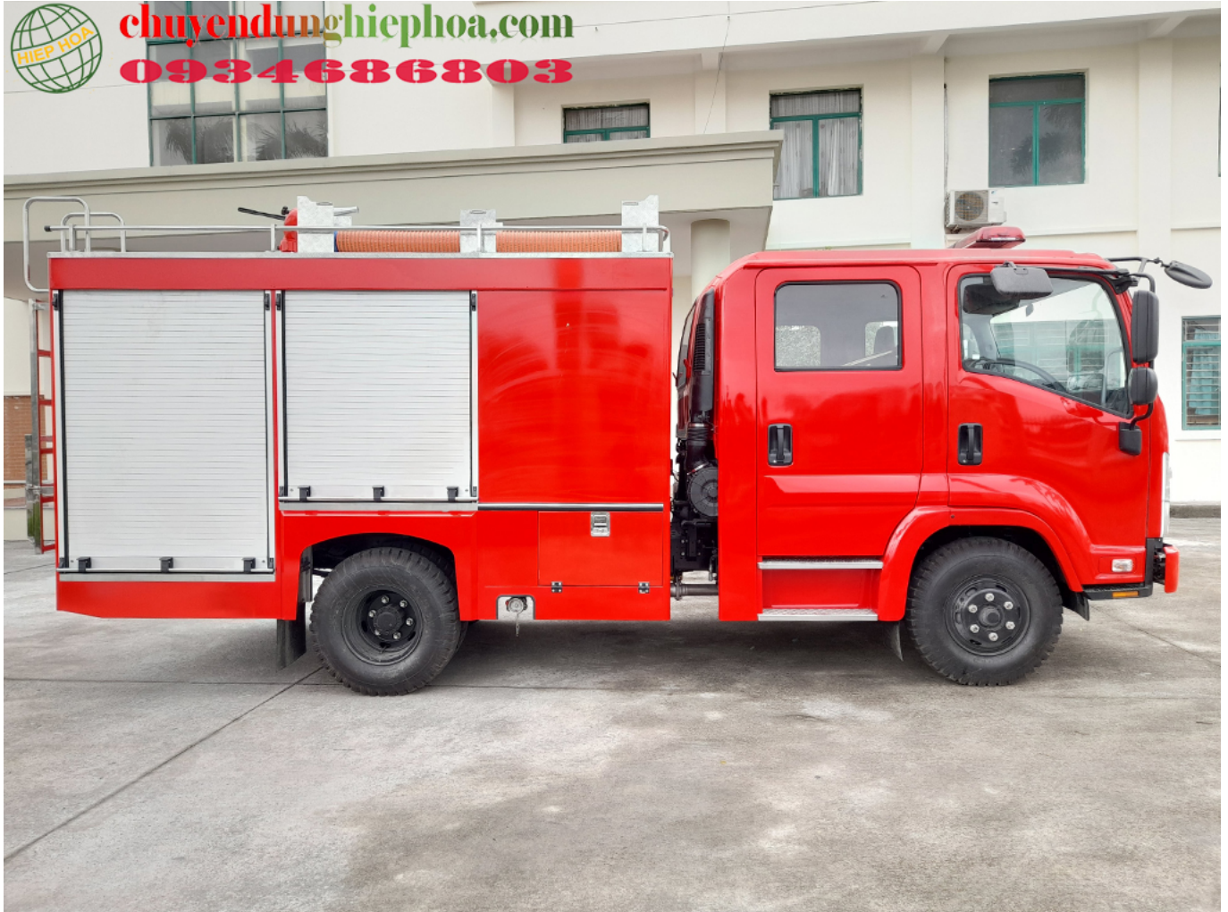
ẢNH CHÍNH DIỆN BÊN PHỤ