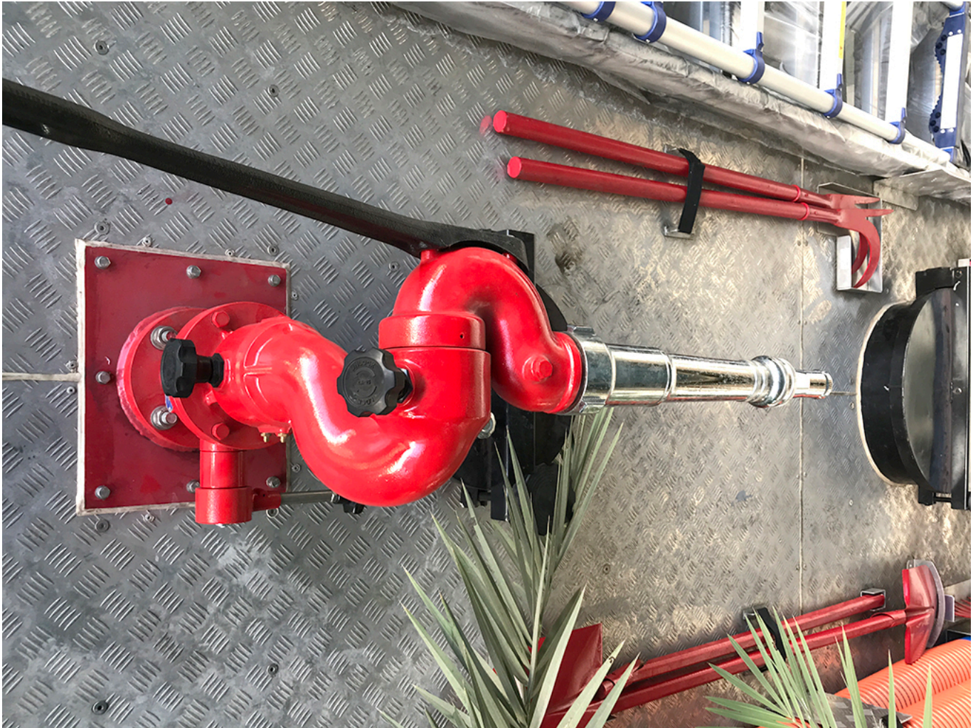
SÚNG PHUN TRÊN NÓC XE CHỮA CHÁY 2,6 KHỐI ISUZU