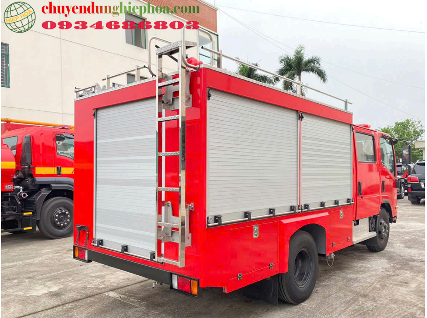
XE CHỮA CHÁY 2,6 KHỐI ISUZU NHÌN PHÍA SAU