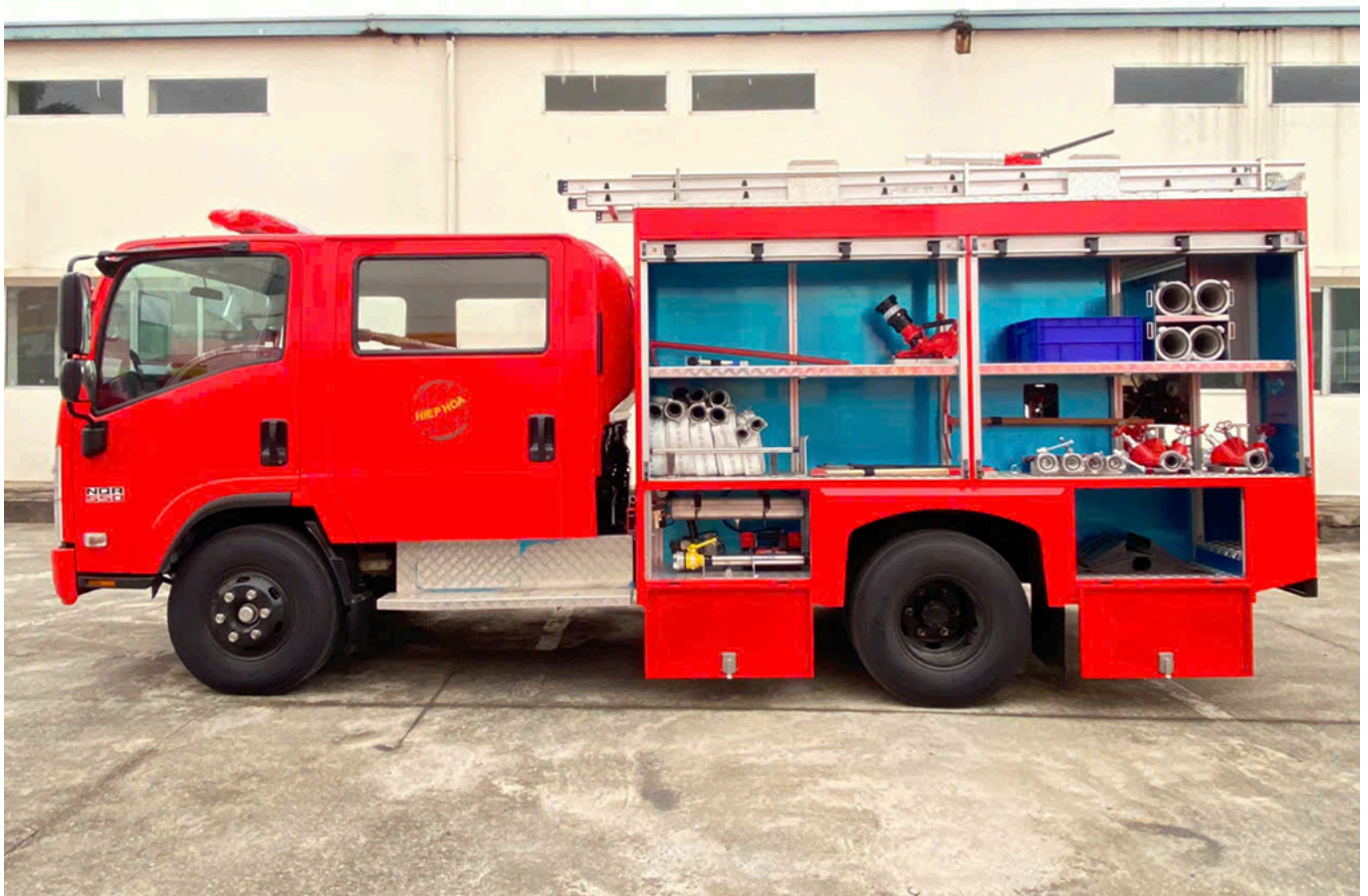
ẢNH CHÍNH DIỆN BÊN LÁI XE CHỮA CHÁY 2,6 KHỐI ISUZU