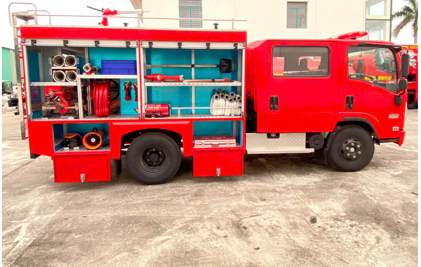
ẢNH CHÍNH DIỆN BÊN PHỤ XE CHỮA CHÁY 2,6 KHỐI ISUZU