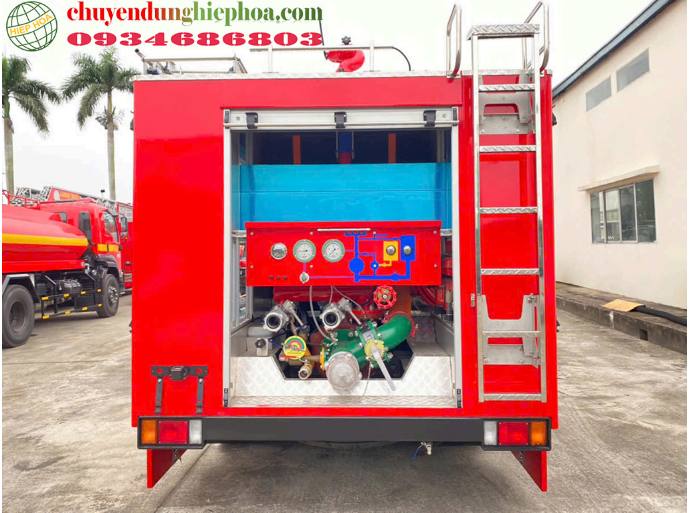
ẢNH KHOANG ĐIỀU KHIỂN BƠM XE CHỮA CHÁY 2,6 KHỐI ISUZU