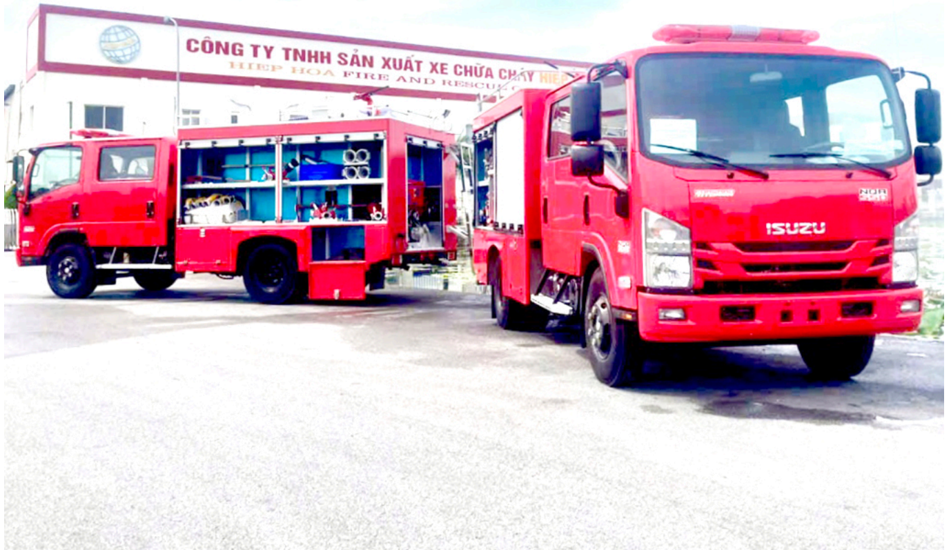
ẢNH XE CHỮA CHÁY 2,6 KHỐI ISUZU ĐANG KIỂM TRA TRƯỚC KHI XUẤT XƯỞNG TẠI CHUYÊN DỪNG HIỆP HÒA