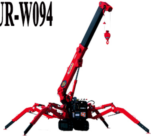
Trang bị tiêu chuẩn